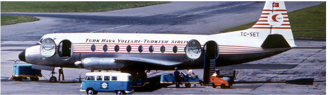
Bir Zamanlar THY

Türk Hava Yolları, Türkiye'nin "bayrak taşıyıcı" hava yoludur. Kurulduğu 5 Mayıs 1933 tarihinden bu yana sürekli gelişme göstermiş ve bugün Avrupa'nın en iyi havayolu unvanına kavuşmuştur. 92 yıllık geçmişinde milyonlarca yolcuya hizmet veren THY, günümüzde 492 uçaklık filosuyla dünyanın hemen her noktasına uçan bir küresel havacılık kıymeti hâline gelmiştir. Varılan bu noktanın Türkiye'nin kamu diplomasisine olan katkısı son derece önemlidir.