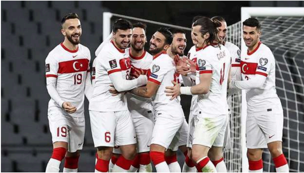
Avrupa Futbol Şampiyonasında A-Milli Takımımız Oyuncuları

Spor, ulusların imajların dış dünyaya tanıtılması açısından daima önde gelen bir araç olmuştur. Çağımız, ulusal kimliklerin öne çıkarılarak bunların üzerinden uluslararası etki kazanma çağıdır. Sportif faaliyetler, özellikle başarılı olduğu takdirde uluslararası imajların dış kamuoylarına iletilmesi adına tüm dünyada yaygın biçimde kullanılmaktadır. Başarılı sporcular, mensubu oldukları ulusların prestijini arttırmaktadır.