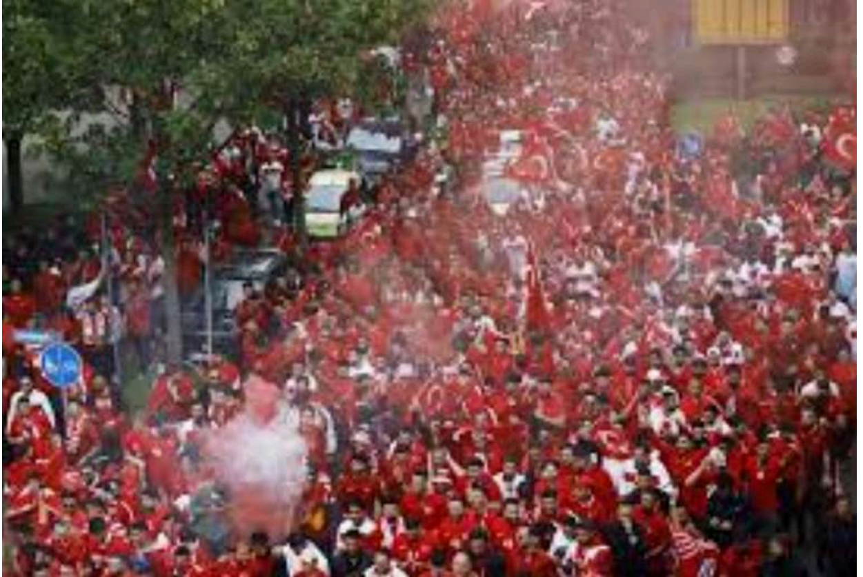
Almanya’da Türk Taraftarlar

14 Haziran-14 Temmuz 2024 tarihleri arasında Almanya’da düzenlenen Avrupa Futbol Şampiyonasında A-Milli Futbol Takımımız başarılı maçlar çıkardı. Yarı finale çıkmasına ramak kalan takımımız, sergilediği oyunla beğeni kazandı. Fakat bunun dışında Almanya’daki yurttaşlarımızın Türk milli takımını coşkuyla desteklemesi Alman kamuoyunda hem ilgi hem de eleştirilere neden oldu. Almanya’da 1961’den bu yana 63 yıldır mevcudiyetini sürdüren ve giderek “diaspora” olarak da adlandırılan Türk varlığının Türkiye’ye olan sağlam bağlılığı, Almanya’daki Türkleri kısmen “güvenlik sorunu” olarak görmeye eğilimli çevrelerin tedirginliğine yol açtı. Bu arada futbolcumuz Merih Demiral’ın, kazanılan Avusturya maçından sonra sevincini “bozkurt işareti” ile ifade etmesi, Almanya İçişleri Bakanının da müdahalesiyle neredeyse iki ülke arasında sayısı az olmayan gerginliklerden biri haline geliyordu. İçişleri Bakanı Nancy Faeser’in girişimi sonucunda futbolcumuza haksız bir ceza verilmesi, belki de milli takımımızın bir sonraki maçta elenmesi sonucunu getirdi. Yaşanan bu olumsuzluğun dışında, Türklerin Türk milli takımına büyük desteği ve coşkusu daima hatırlanacak.