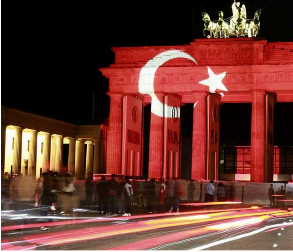
Berlin, Brandenburg Kapısı

Diasporalar, aslında menşe ülkesi ile yerleşilen ülke ilişkilerinde yakınsamayı mümkün kıldıkları gibi egemenliklerin tehdidi algısı bağlamında bir gerginlik vesilesi de olabilmektedir. Dış politikalarda bir etkinlik aracı olarak görülen diasporalar içinde yaşadıkları ülkelere zarar da verebilmektedir. Bunu en açık biçimde irdeleyen John J. Mearsheimer ve Stephen M. Walt “The Israel Lobby and U.S. Foreign Policy” (Farrar, Straus and Giroux, Newyork 2007) kitabında, İsrail’in ABD’deki güçlü lobisi vasıtasıyla Amerikan ulusal çıkarlarına aykırı kararlar alınmasına neden olduğunu belirtmektedirler. Günümüzde Ortadoğu’da yaşanan krizlerin arkasında İsrail diasporasının faaliyetlerinin bulunduğunu ileri sürmek yanlış olmayacaktır.