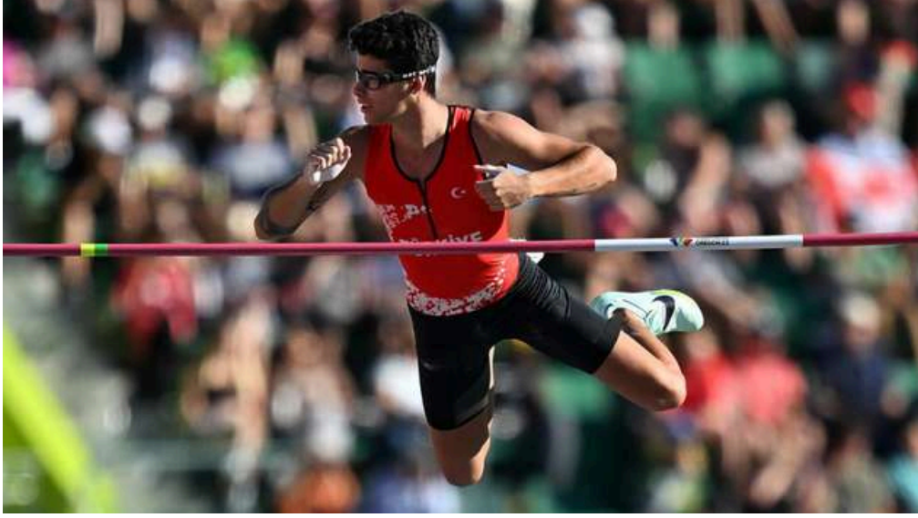
Sırıkla yüksek atlama finalinde olimpiyat beşincisi olan milli atletimiz Ersu Şaşma

Spor, ulusların imajların dış dünyaya tanıtılması açısından daima önde gelen bir araç olmuştur. Çağımız, ulusal kimliklerin öne çıkarılarak bunların üzerinden uluslararası etki kazanma çağıdır. Sportif faaliyetler, özellikle başarılı olduğu takdirde uluslararası imajların dış kamuoylarına iletilmesi adına tüm dünyada yaygın biçimde kullanılmaktadır. Başarılı sporcular, mensubu oldukları ulusların prestijini arttırmaktadır.