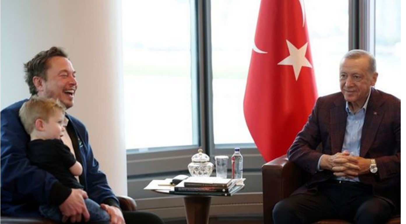
New York Türk Evi'nde Cumhurbaşkanı Erdoğan Elon Musk görüşmesi, 18 Eylül 2023