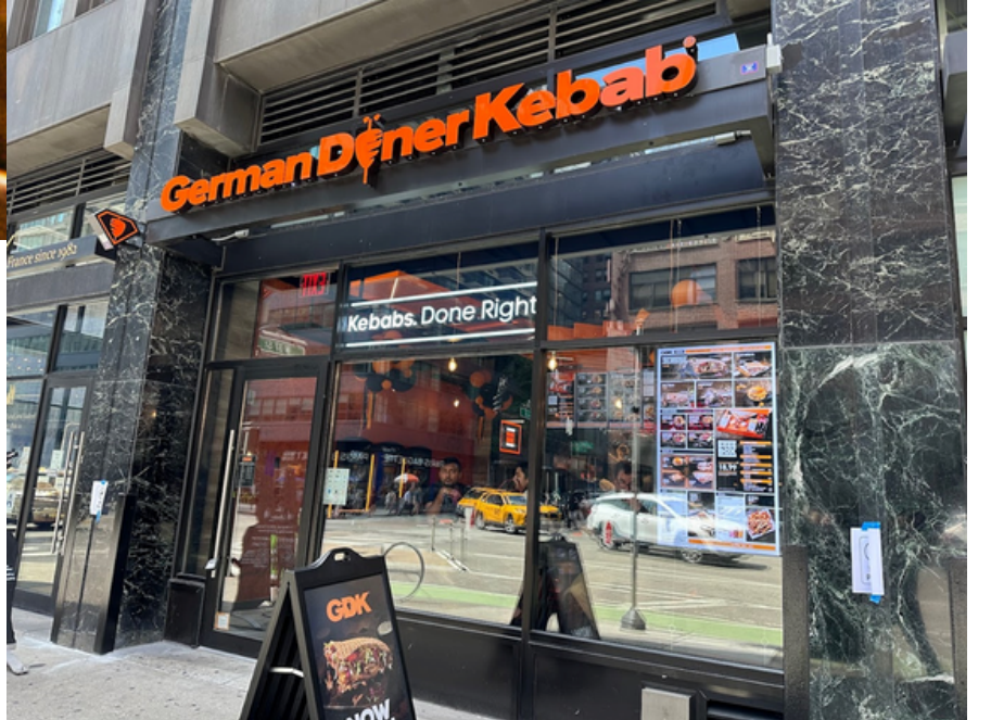
New York 6. Cadde, No. 10018 adresindeki “Alman Döner Kebab” lokantası