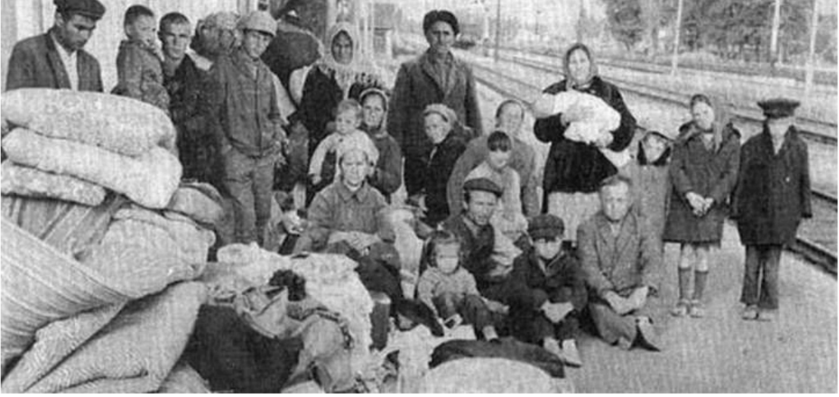
Stalin tarafından yurtlarından sürülen Kırım Tatarları (1943)

Irklar yoktur, ama kültürlerin özelliklerini belirleyen biyolojik ve biyofiziksel etkenler ile kültüre biyolojik tepkimeler vardır şeklinde özetleyebileceğimiz yeni ırkçılık, “kendi kültüründen olmayana karşı” koymanın, nefret duymanın ve gerekli görüldüğünde saldırganlaşmanın doğal gerekçesini savunmaktadır. Bu düşünceleri uluslararası ilişkilere taşıdığımızda, devletler arasındaki ilişkilerde benzeri yaklaşımların var olduğu görülmektedir. Güçlü devletin – farklı çıkar gerekçeleri ile olsa da – zayıf devlet üzerinde tahakküm kurma arzusunda ve kararlılığında, harekete geçmesinin en azından meşruiyetinin izahı ve etik çekincelerin saf dışı bırakılması açısından kendisini haklı görmesi söz konusudur. Bununla birlikte, kültürler arasında küresel iletişimin, mobilitenin ve dolayısıyla etkileşimin bu denli geliştiği günümüzde, giderek kültürcü ırkçılığın da etkisinin azalacağı ve yakın gelecekte bir ırkçılık sonrası dönemin yaşanacağı düşüncesi de göz ardı edilmemelidir.