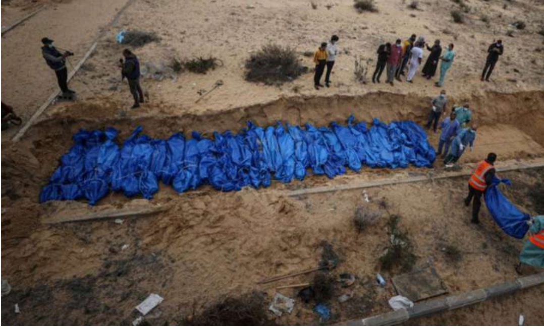
Gazze, 2023 - 2024