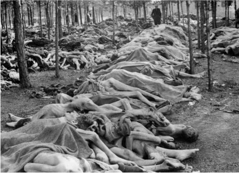
Yirminci Yüzyılın Yüzkarası: NAZİ Almanyası'nın trajik eseri...

lü karşı önlemlerin alınmadığı hallerde onunla mücadele, gereken sonucu veremez, vermemektedir. Nitekim ırkçı akımlara ve ırkçı şiddete mevcut egemenlik ve iktidar ilişkilerini tehdit etmedikleri ölçüde göz yumulmakta, böylece ırkçı terörün ekmeğine farkında olmadan yağ sürülmektedir. İkinci Bölümde ele alınan 2000-2006 yılları arasında Almanya'da kaydedilen örgütlü ırkçı cinayetlerin soruşturulmasında devlet birimleri ve siyaset kurumunun aymazlıkları bu düşüncelerimizi doğrular niteliktedir.